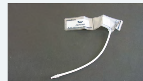
NIBP Disposable use cuff