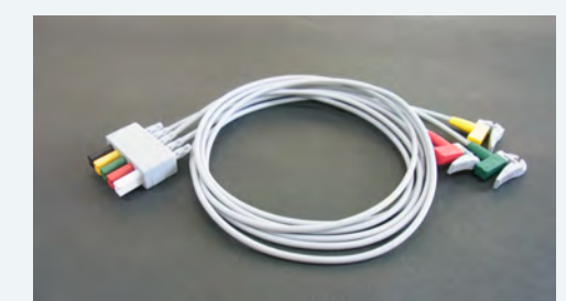
ECG lead set