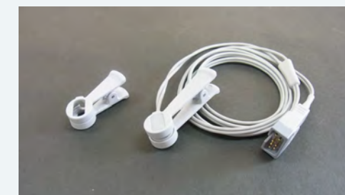
7Pin SPO2 Sensor