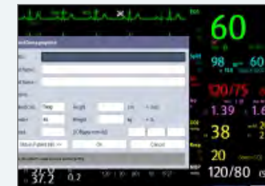
Patient Demographic Menu